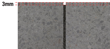
TEGELS OF STENEN ZONDER FACET